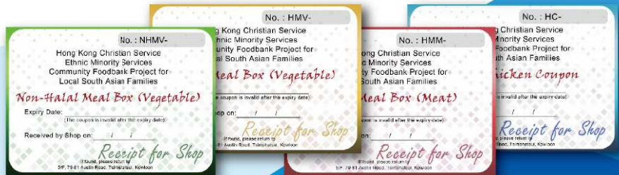
合資格受助人憑換領券，到指定餐廳及南亞商舖換領新鮮飯盒及新鮮清真肉類。