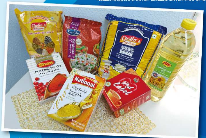
南亞糧油雜貨及包裝食品